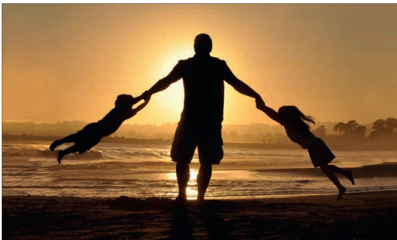
Forældrene har stor betydning for, hvilket gudsbillede børnene får