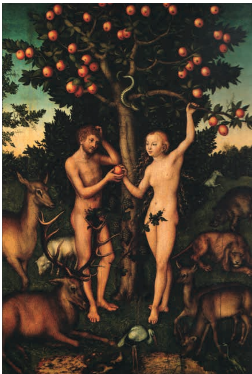
"Far, jeg ville ønske, at jeg havde været den første, som kom ind i den have. For så ville jeg ha' taget en økse og ødelagt det træ!"

Vores identitet og dermed selvbillede udvikles i relation til andre, vigtigst i relation til de primære omsorgspersoner. Disse omsorgspersoner danner os gennem kvaliteten af nærhed, trøst, tryghed og affektregulering. Afspejlingen af forældrene udgør forældre billedet, og relationserfaringen skaber en indre arbejdsmodel for