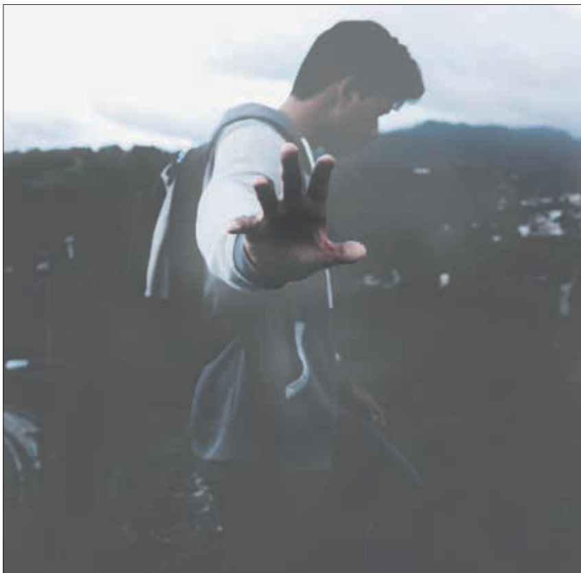
Nogle anfægtes af, at deres indre gudsbillede ikke finder genklang i virkeligheden

»» 1. De virkelige forældre. Barnets forhold til den fraværende og den skrøbelige forælder afspejles i indre billeder af en fraværende og en skrøbelig gud.