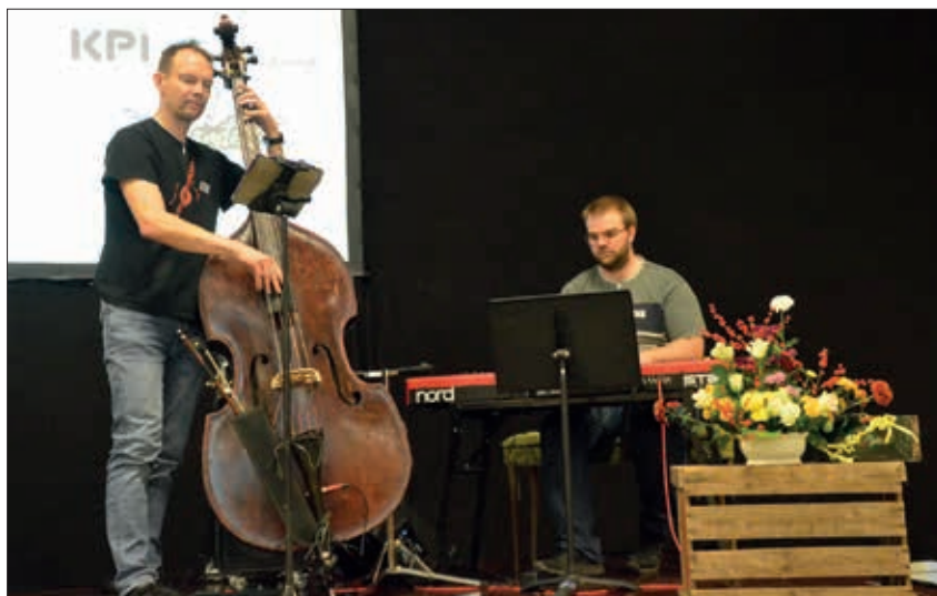
Sang og musik skal der til, når kristne efterskolefolk mødes.

Mediehøgskolen i Kristiansand. Her er nogle glimt fra dagene. 🌱