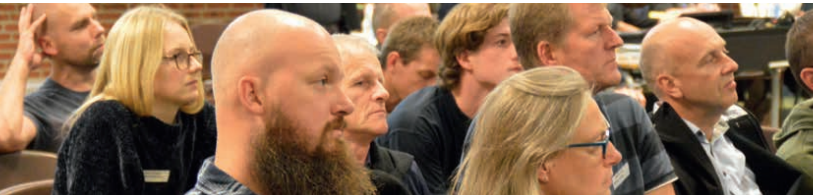
Der lyttes intenst, men i pauserne gik snakken lystigt ved KPI's efterskolekursus på Solgården i Tarm. Se mere på bagsiden.